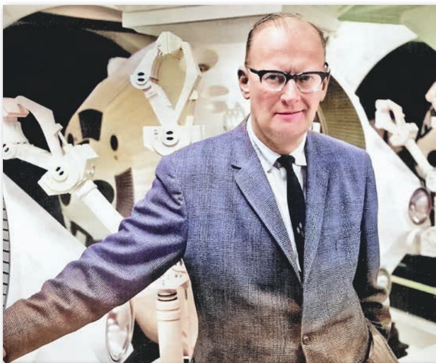
Arthur C. Clarke při natáčení filmu 2001: Vesmírná odysea, 1965

Clarke je považován za jednoho ze tří nejvýznamnějších autorů science fiction, spolu s Robertem Heinleinem a Isaacem Asimovem, někdejším dlouholetým místopředsedou Mensy International. Ten prohlásil, že „jedinými inteligentnějšími lidmi, které kdy potkal, jsou Carl Sagan a Marvin Minsky“, zatímco Arthura C. Clarka popsal jako jediného spisovatele, který ho znepokojoval. S jinými autory sci-fi se totiž při rozhovoru jako profesor biochemie snadno dostal na koně tak, že s těmi, co psali science fiction, obrátil řeč k čiré vědě, zatímco s vědeckými autory zase přešel k science fiction. S Clarkem ale tuto taktiku použít nemohl, protože vynikal v obou oborech.