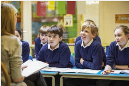
Boris a dinosauři odhalují na matiku nadané žáky. Cílem je lepší rozvoj dětí | iDNES, mensa.click/te

Z nadaných dětí ty takzvané „normální“ prostě neuděláte | Reportér Magazín, mensa.click/te