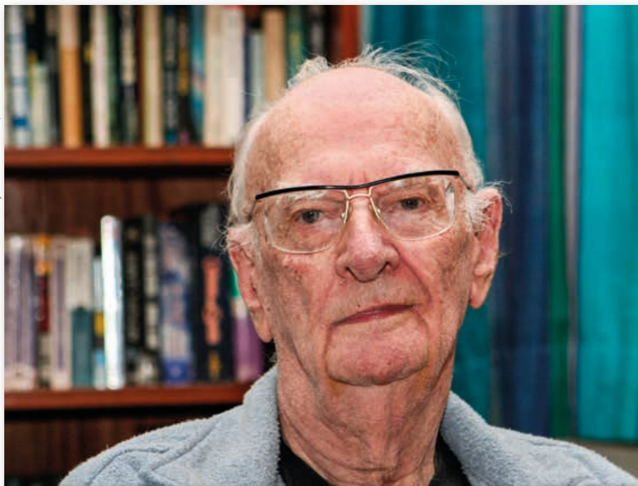
Arthur C. Clarke ve svém domě v Kolombu na Srí Lance, 2006

Myšlenku vesmírného výtahu Clarke detailně popsal ve své knize Rajske fontány, ke které ho inspirovalo prostředí Cejlonu (dnešní Srí Lanky). Tam se v roce 1956 přestěhoval –