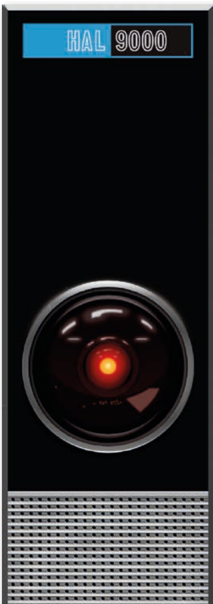
Design panelu počítače HAL 9000 pro film 2001: Vesmírná odysea

původně za potápěním, strávil tam ale dalších 52 let až do své smrti.