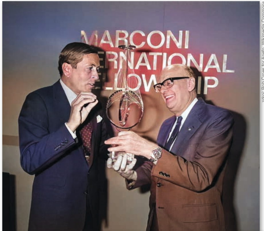
Princ Claus Předává Arthuru C. Clarkovi ocenění Marconi International Fellowship Award 1982

Ve stejném rozhovoru předpovídal, že v budoucnosti budeme cestovat po potěšení,